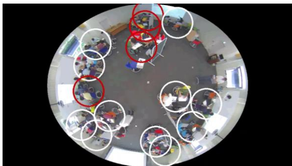
図 3.活動立ち上がりの可視化. 白円は各グループ. 赤円は活動立ち上がりを検出したグループ.

始まった, 1人が席を立ち話し合いが止まった, メンバー全員がノートに何かを書き始めたといった活動が見られた箇所は勾配が急であった. これらはそれぞれグループワークにおける議論と個人作業の契機であるといえる. つまり, このフレーム間差分の増加量に着目することでグループ内の活動の契機を検知することができると考えられる. このフレーム間差分量の増加量は活動立ち上がりを示しうるもの